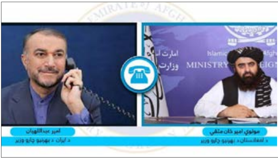
امیر عبداللهیان د ایران د بهرنیو چارو وزیر (د لاسه) او مولوي امیر خان متقي د افغانستان د بهرنیو چارو وزیر (د لاسه)

د بهرنیو چارو وزارت د ویاند مرستیال ضیا احمد تکل پرون په خپله اکس ټولنیزه پاڼه کې لیکلي، چې د ایران د بهرنیو چارو وزیر امیر عبداللهیان له مولوي امیرخان متقي سره تلیفوني خبرې وکړې، د بهرنیو چارو وزارت د هرات ولایت د زلزلې له قربانیانو سره خپله خواخوږي څرګنده کړه او له زلزلې څخه هر ډول همکارۍ ته یې چمتووالي ۵ مخ