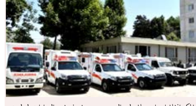
د یونیسف نړیوالې ادارې له لوري وړاندې شوي ۲۴ ساعته ۵ مخ

د زابل د عامې روغتیا ریاست مسئولین وايي، چې په نوبهار، د دغو درېو ولسوالیو روغتیايي مرکزونو ته امبولانسونه