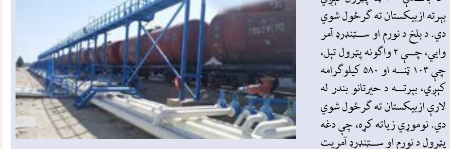
د حیرتان بندر مسئولین وايي، چې په دغه بندر کې دوه واګونه چې بېرته ازبیکستان ته گرځول شوي دي. د بلخ د نورم او سټندرد آمر وايي، چې ۲ واګونه تېل تېل، چې ۱۰۳ تنه او ۵۸۰ کیلوګرامه کېږي، بېرته د حیرتان بندر له لارې ازبیکستان ته گرځول شوي دي. نوموړي زیاته کړه، چې دغه تېرول د نورم او سټندرد آمریت په لابراتوارونو کې له چک وروسته د افغانستان د نفتي توکو

د نورم او سټندرد سره په ټکر کې او بې کیفیته ثابت شول، چې