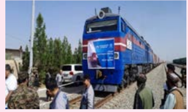
کانټینرې سوداګریز توکي د سوداګریز توکي پروم له

د وسپنې پټلۍ ادارې مسئولین وايي، چې له چین څخه ۲۲ د وسپنې پټلۍ له لارې هیواد ته رالېږدول شوي دي. دغه ادارې د مسئولینو په وینا: دغه سوداګریز توکي چې د لېږدوونکو وسایطو پرېزې په کې شاملې دي، د ازبیکستان او قرغزستان له لارې له سو ورځو وروسته له چین څخه د بلخ حیرتان بندر ته راوړسېدلې دي. په ورته وخت کې د بلخ والي وايي، د سیمې هیوادونو سره سوداګریزه راکړه ورکړه د هېواد په اقتصادي وده ۵ مخ