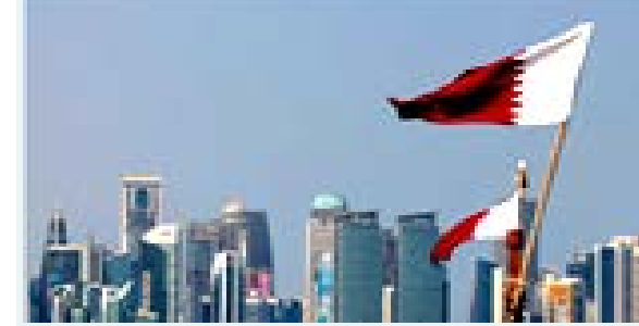
يوسف لارام هم گډون کړی و. په اعلاميه کې راغلي، چې يوسف لارام په دغې غونډه کې ټينگار ملاتړ ته دوام ورکوي او د افغانانو د بشري وضعیت د ښه کولو لپاره خپلې هېڅ مرستې نه سپموي.

د قطر د بهرنيو چارو وزارت په اعلاميه کې ويلي، چې د افغانستان په اړه د مسکو فارمې پنځمه غونډه کې د ياد وزارت د آسيايي چارو مشر يوسف بن سلطان