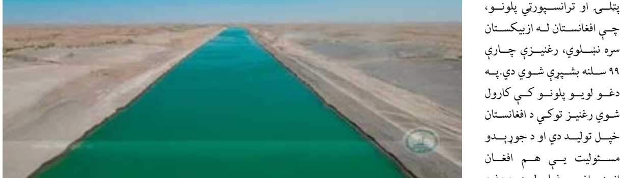
بشپړې شوې دي او چارې يې دېرې په چټکۍ سره روانې يې تر را تلونکې يوې اوونۍ پورې پای ته ورسېږي. د قوش تپې کانال د پلونو جوړولو د تخنيکي چارو قراردادي انجنيران وايي: دا مهال د دغو پلونو ۹۹ سلنه چارې سرته رسېدلي او د پاتې برخې کار به

د تخنيکي چارو قراردادي انجنيران وايي: دا مهال د دغو پلونو ۹۹ سلنه چارې سرته رسېدلي او د پاتې برخې کار به