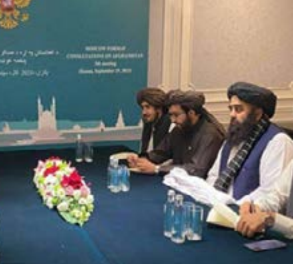
د قرغزستان جمهوريت په دې کتنه کې دواړو لوريو بشري مرستو هر اړخيزې

د بهرنيو چارو وزارت سرپرست مولوي امير خان متقي، د مسکو فارمې په غونډه کې د افغانستان او قرغزستان پر دوه اړخيزو اړيکو او له افغانانو سره د قرغزستان پر له ځانگړي استازي طلعت بېگ سره وکتل. د ياد وزارت د خبر پاڼې د معلوماتو له مخې؛