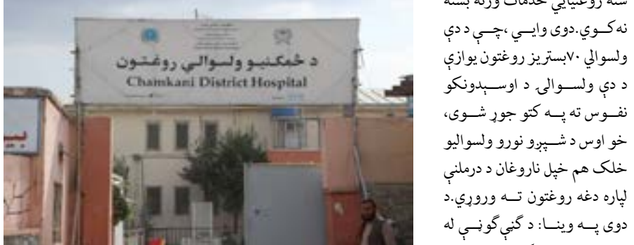
د پکتيا د ځمکنيو ولسوالۍ اوسېدونکي وايي، چې دغې ولسوالۍ کې نفوس زيات دي او شته روغتيايي خدمات ورته بسنه نه کوي. دوی وايي، چې د دې ولسوالي ۷۰ بستريز روغتون يوازې د دې ولسوالۍ د اوسېدونکو نفوس ته په کتو جوړ شوی، خو اوس د شپږو نورو ولسواليو خلک هم خپل ناروغان د درملنې لپاره دغه روغتون ته وروړي. د دوی په وينا: د گڼې گونې له امله يې روغتون کې د ناروغانو شمېر زيات او امکانات کم وي، چې له ستونزو سره يې مخ کړي دي. د پکتيا د ځمکنيو ولسوالۍ اوسېدونکي زياتوي، چې ياد

روغتون کې پرمختللي اېکسري ماشينونه شتون نه لري او ناروغان اړ دي، چې د اېکسري لپاره کابل