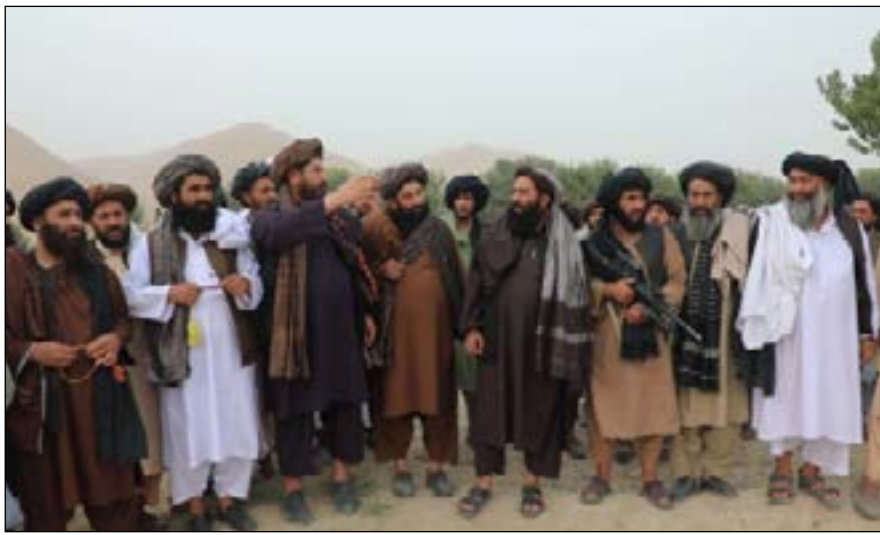
اسلامي امارت د هيواد د مالونو د صادراتو او وارداتو لپاره د باغيس ولايت په بالامرغاب آسانتيا په موخه ده. د اسلامي امارت د وياند د څرگندونو په

د پاکستان د حکومت له خوا له ۹ ورځو راهيسې د تورخم بندر له تړل کېدو وروسته اوس