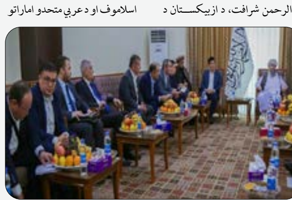
ترانسپورت وزیر الهام محموف او د دې هیواد د کانونو وزیر بابر

د افغانستان، ازبیکستان او عربي متحدو اماراتو ترمنځ درې اړخیزه غونډه، پرون په کابل نړیوال هوايي ډگر کې ترسره شوه. د ترانسپورت او هوايي چلند وزارت د یوې خبرپاڼې په خپرولو سره ویلي، چې په دې ناسته کې د ترانسپورت او هوايي چلند وزارت سرپرست ملا حمیدالله آخندزاده، د کانونو او پترویم وزارت سرپرست شېخ شهاب الدین دلاور، د افغانستان د وسپنې پټلۍ ادارې رئیس ملا بخت