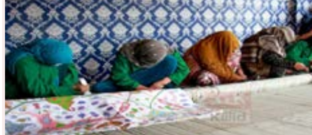
سیمو او دهادي ولسوالۍ کې د غالی اوبدلو پنځه مرکزونه فعال کړي او نږدې ۴۵۰ ښځو ته یې په وړیا ډول زده کړه ورکړي. ۵مخ

پکې د کار کولو زمینه برابره کړې ده. د نوموړي په وینا: له دې کاره یې موخه پر کور ناستو ښځو ته د کاري فرصت برابرول دي او