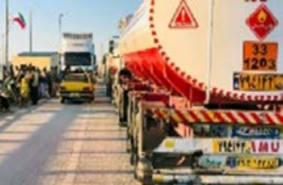
سټنډرډونو سره یې مطابقت خبرپاڼې په خپرولو سره ویلي،

چې په تېره یوه اوونۍ کې یې د فراه په ۷۸ میل بندر کې ۷۵ ټانکره بې کیفیته تیل (ډیزل) او پټرول) چې د دې ادارې له