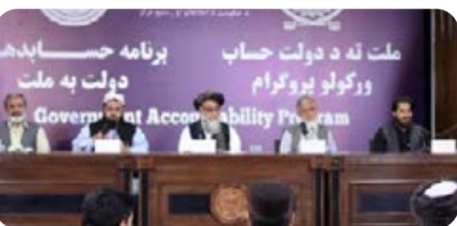
ملت نه دولت حساب و و رکولو پروگرام دولت به ملت Government Accountability Program

مقام‌های اداره ورزش کشور روز شنبه در برنامه حساب‌دهی دولت به ملت گفته‌اند که بیش از ۳ هزار برنامه مناسبتی و رسمی را به هدف رشد ورزش در سطح کشور در یک سال ص ۴