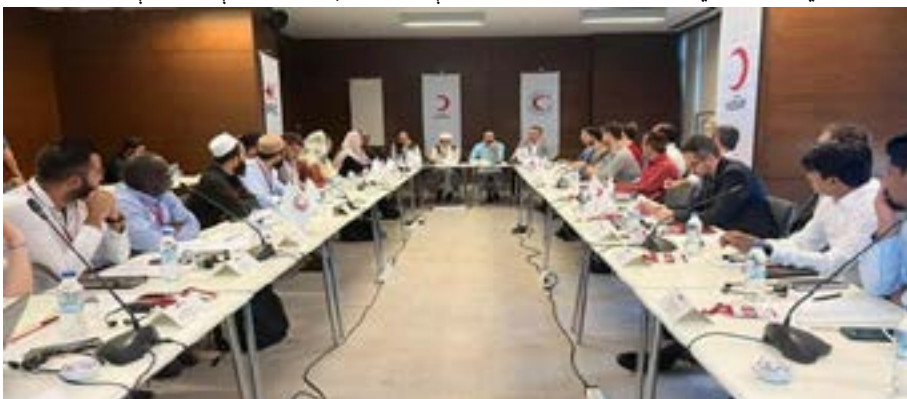
شمېر په زياتولو او په نشه يي توکو مرستې، د کونډو او بې سرپرسته کورنيو د لاسنيوي، درواڼي ناروغانو د درملنې او ساتنې، درضا کارانو د درملنې او ساتنې، درضا کارانو د شمېر په زياتولو او په نشه يي توکو د روږدو ۵مخ

د افغانستان کې پر بشري فعاليتونو او د بشري مرستو پر جلب او يو شمېر نورو موضوعاتو گډه ناسته ترسره شوه. په ياده ناسته کې د افغاني سرې مياشتې او نړيوال فدراسيون د مسئولينو ترمنځ د افغانستان پر اوسني وضعيت،