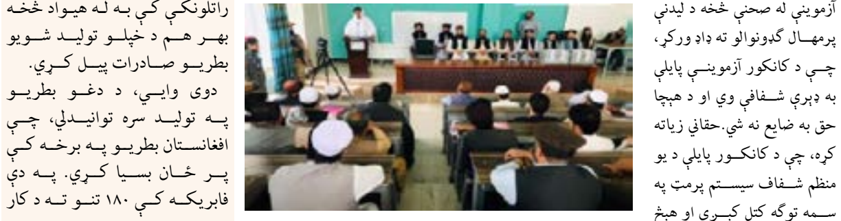
سپارل کېږي. ورته مهال په دې ولايت کې د کانکور گډونوالو د آزمويڼې د ملي ادارې له رهبرۍ څخه مننه وکړه، چې د کانکور آزمويڼې په پروسې کې يې آسانتياوې رامنځته کړې دي. دوی همدارنگه د آزمويڼې د پايلو پر شفافوالي ټينگار وکړ. د آزمويڼو ملي ادارې اوسنۍ رهبرۍ د کانکور په پروسه کې مثبت بدلونونه راوستي چې له امله يې په پوهنتونونو کې د پرمختگ سبب شوي دي.

د آزمويڼو د ملي ادارې رئيس شيخ عبدالباقي حقاني پکتيا ته د سفر په ترڅ کې د کانکور آزمويڼې له صحنې څخه د ليدنې پرمهال گډونوالو ته ډاډ ورکړ، چې د کانکور آزمويڼې پايلې به ډېرې شفافې وي او د هېچا حق به ضايع نه شي. حقاني زياته کړه، چې د کانکور پايلې د يو منظم شفاف سيستم پرمت په سمه توگه کتل کېږي او هېڅ لاسوهنې ته به کې ځای نشته. ده په وينا: د سړني کانکور پوښتنې ساده او د تعليمي نصاب مطابق جوړې شوې، چې په همدې اساس به حق حقدار ته