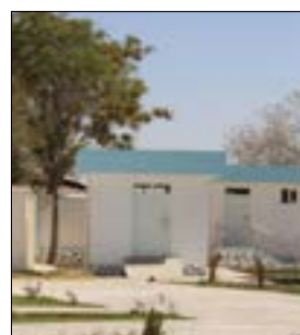
ورته د لاسرسي په برخه کې ستونزې لري لاسرسي په برخه کې کوي، هغو سيمو ته چې دې ته

ورته د روغتيایي خدمتونو په برخه کې کار نه دی شوی پاملرنه وکړي. په همدې حال کې د دغه ولايت د عامې روغتيا رئيس ډاکټر ميرويس افغان وويل، هڅه کوي هغو سيمو ته چې خلک يې له روغتيایي خدمتونو بې برخې دي او يا هم خلکو لاسرسي هم زيات شوي دي. ورته مهال د زابل يو شمېر اوسېدونکي هم اوس مهال دې ولايت کې د روغتيایي خدمتونو د ښه والي خبره کوي او وايي: اوسمهال په ډېره لرې پرته سيمه کې روغتيایي مرکز شتون لري او غوره خدمتونه په کې وړاندې