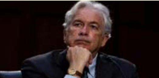
پوتین پر ضد د يوه پاڅون مشري وکړه. د سي.آي.اې مشر ولېيم برنز

د امریکا د استخباراتي ادارې يا سي.آي.اې مشر وايي: ولاديمير پوتین د واکمن ډلې مشر ښکېږي پرېگوژين نه د غځ اخيستلو لپاره پلان جوړولو باندې لگيا دی. ښاغلي پرېگوژين شاوخوا يوه ماشت مخکې د ولاديمير