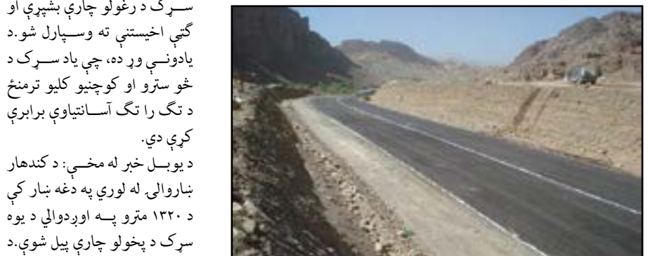
لس کيلو مترو سرک د رغول الله غوثي د باختر آژانس خبريال

د غور د کليو د بيارغونې او پراختيا رياست مسئولينو د دغه ولايت په فېروزکوه ښار کې د