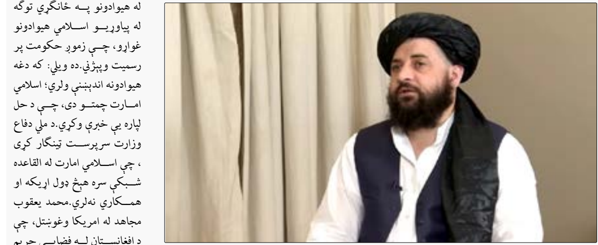
يغقوب مجاهد ويلي: اسلامي امارت د رسميت پېژندنې شرايط کبله هغه پر رسميت نه پېژني. محمد يعقوب مجاهد د سعودي امارت د رسميت پېژندنې شرايط

د افغانستان د ملي دفاع وزارت سرپرست وزير مولوي محمد يعقوب مجاهد: کبله هغه پر رسميت نه پېژني. محمد يعقوب مجاهد د سعودي امارت د رسميت پېژندنې شرايط