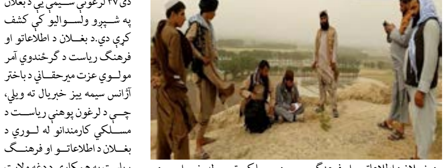
د مسلکي ټيم له خوا چې د اطلاعاتو او فرهنگ وزارت په لارښوونه بغلان ته لېږل شوی

دې ۳۷ لرغونې سيمې يې د بغلان په شپږو ولسواليو کې کشف کړې دي. د بغلان د اطلاعاتو او فرهنگ رياست د گرځندوي آمر مولوي عزت ميرحقيقي د باختر آژانس سيمه ييز خبريال ته ويلي، چې د لرغون پوهنې رياست د مسلکي کارمندانو له لوري د بغلان د اطلاعاتو او فرهنگ رياست په همکاري د دغه ولايت په خوست، گزرگاه نور، فرنگ، نهرين، ۴۰۰۰مخ