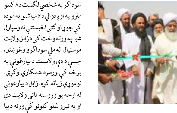
ييز خبريال ته ويلي، چې په دغه ولايت کې دارواښاد امير المؤمنين

گټې اخيستنې ته وسپارل شو. د زابل ځايي مسئولينو د باختر آژانس سيمه