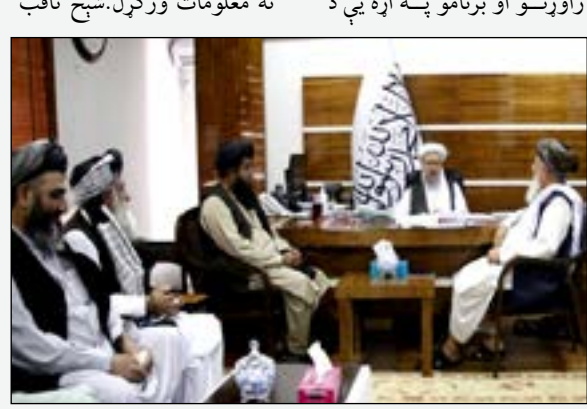
د رياست الوزرا اداري معاونيت د علومو اکاډمي د هيواد له مهمو

راوړنو او برنامو په اړه يې د علمي مرکزونو څخه وبلله، چې د نورو علمي بنسټونو ترڅنگ په هيواد کې د علومو د پراختيا او پرمختگ لپاره فعاليت کوي، ترڅو د اکاډميکو پروژو ريسرچ، تايمين او انکشاف ته ځانگړې پاملرنه وکړي. ورته مهال مولوي عبدالسلام حنفي د افغانستان د علومو اکاډمۍ له مسئولينو سره پر کتنې د خوښۍ ترڅنگ په هيواد کې په علمي او اکاډميکو برخو کې ۵۰۰ مخ