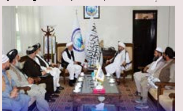
بې د هيواد د پرمختگ لپاره سرتاسري امنيت، او د پانگونې

حکومت د سياسيونو راستنېدل، پر فرصتونو باندې خونې ښوونځي او له اسلامي امارت سره