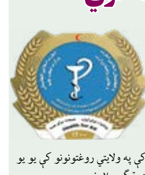
کې په ولایتي روغتونونو کې یو یو دسترګو... ۷۰۰ مخ

وینا، دهبودتولو ولایتونو په هر روغتون کې به دسترګو ددرملنې دایمي مرکز پرانېزي او له دې لارې به دسترګو ناروغانو درملنه وکړي. ده وویل: (( روان کال کې ۴۲۰۰ دسترګو عملیاتونو پلان لرو، چې دافغانستان په ۱۷ ولایتونو کې به وشي. ترڅنګ به یې په راتلونکي کې په هر ولایت