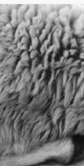
د هدي عيال داره و داسي كومه فراخي د رزق له مخې څخه ده ته حاصله نه وه چې پر خپل عيال باندي فراخي وكړي بيا مندوبه داده چې ټوله غوښه د اضحيه خپل عيال ته پر سردي صدقه او اطعام به ترې نه كوي پدې صورت كې بيا پرېښودل دغوښي د اضحيه بل چاته غږيدل عيال څخه) مكره ده. المثقف من الفتاوي - ابو عبدالله ميرغلام جيلاني - دريم جلد - ص ۳۸۰. كه ژوندۍ يې صدقه كړي وچوب دهدي يا اضحيه ترې نه ساقطېږي:

ژباړه: په عمياء يعنې چې په دواړو سترگو وړند وي او په عوراء يعنې چې يوه سترگه يې بالكل نه وي او په عرجاء يعنې چې په دريو پښو باندي ځي او څلورمه پښه بالكل پر ځمكه باندي نشي لگولى او نه په ټللو كې كوم كمك ترلاسه كولى شي او په مريض باندي چې مرض يې ښكاره وي او پسر هغه باندي چې غوړونه يا لږ يا لكې يې بالكل يعنې بيخي نه وي يا له بيخ څخه پرې شوي وي او يا پيداشي بالكل نه وي، اضحيه او هدي پرې جائز څخه نه كوي كه چيرې څښتن