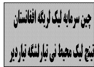
چین سر مابه لیک لریگه افغانستان بیز لیک محیطی تارلسک بار دیر

عضولری بیلن ارگ ده اوچره شیدشدی. شول اوچره شیدشه خاتین لرحق لری بولمیده جمهوررئیس نینگ قیلگن سونگی ایشلری و اصلاحاتی دن حمایت قیلیش لیگ لرنی اعلان قیلدی لر. اولر شوندی ایسته دیلر حکومت شو اصلاحات اساسی ده خاتین موندن کین قیله آله دیلر استعدادی یوزیدن اوز نینگ اصلی مقامینی قولگه کتیرسه ، جمهوررئیس اشرف غنی کمیسیون عضولریدن متتدار لیگ قیلیب بشرحق لری بولمیده اولر همکار لیگ لری و بیللی پیشنهادلرنی ایسته دی .