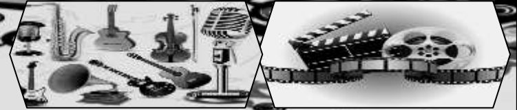
تمتدی صفحه: شفیق پدرو