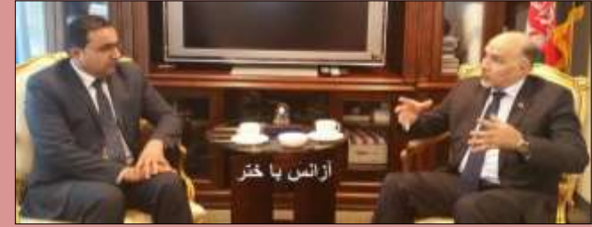
که محمد اشرف غنی رئیس جمهوری اسلامی افغانستان توجه خاص به جوانان داشته و بیشتر تأکید کرده است مصر، مکزیکو و شماری از کشورهای دیگر که کنفرانس ها و نشست های را برگزار کرده اند و تعدادی از