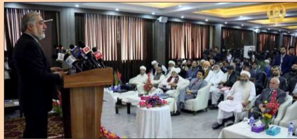
سمینار بین المللی علمی - تحقیقی " نقش تصوف در گسترش فرهنگ اسلامی " دیروز در کابل برگزار شد. به گزارش خبرنگار آژانس باخت: این سمینار به اهتمام وزارت کشور، شماری از اعضای کابینه داکتر عبدالله عبدالله رئیس اجرائیه حضور داشت

وکلاي شورای ملی، مسئولان دولتی، شخصیت های روحانی و فرهنگی، علما، اهل طریقت و مهمانان خارجی، برگزار شد.