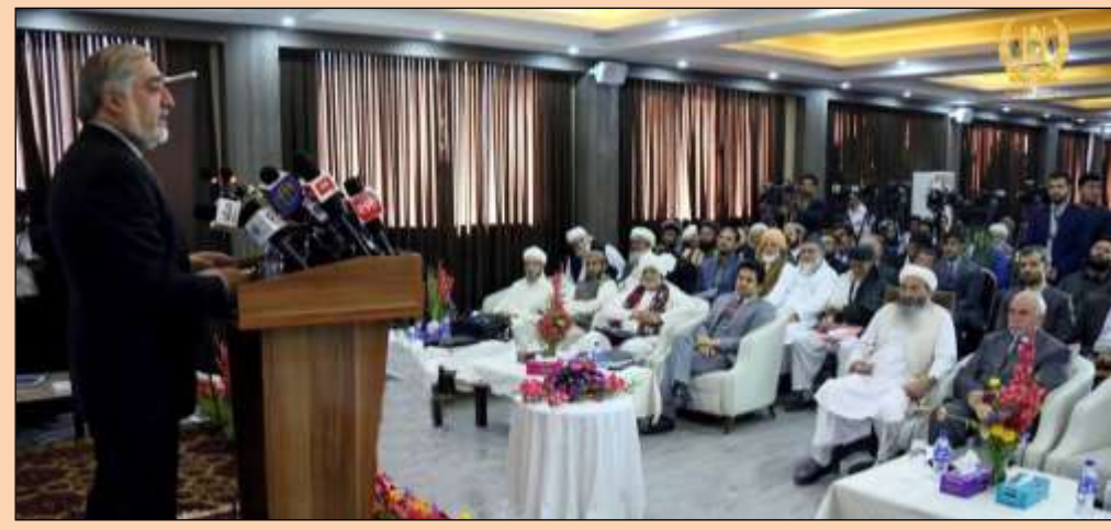
سمینار بین المللی علمی - تحقیقی " نقش تصوف در گسترش فرهنگ اسلامی " دیروز در کابل برگزار شد. به گزارش خبرنگار آژانس باخت: این سمینار به اهتمام وزارت کشور، شماری از اعضای کابینه داکتر عبدالله عبدالله رئیس اجرائیه حضور داشت

وکلاي شورای ملی ، مسئولان دولتي ، شخصیت های روحانی و فرهنگی ، علما، اهل طریقت و مهمانان خارجی ، برگزار شد.